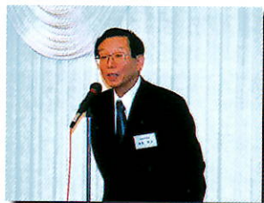
保健福祉部 麻生部長あいさつ